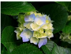
Abbildung 1: Blume; Office 2010.

Abbildung Nr. ....: Titel; Quellenangabe.